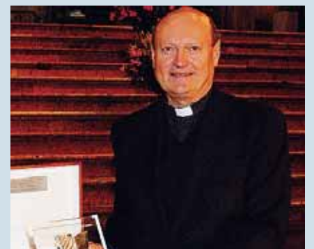
Il cardinale Gianfranco Ravasi oggi sarà in Santa Lucia

«Coerenza e rispetto» come atteggiamento di partenza. Volontà di superare la «superficialità» che ostacola il «dialogo-incontro» stingendo «la fede in una vaga spiritualità» e riducendo «l'ateismo a una negazione banale e sarcastica». Consapevolezza che «da un simile incontro non si esce mai indenni, ma reciprocamente arricchiti e stimolati». Questi gli elementi che il cardinale Gianfranco Ravasi offre ai lettori dell'Osservatore romano presentando "Il Cortile dei gentili", che stamane alle 10 esordirà all'Università di Bologna (in Santa Lucia), presente lo stesso ministro della cultura del papa. Il "Cortile" è stato creato per desiderio di Benedetto XVI per favorire l'incontro tra credenti e non credenti. Indicando come compagno di strada in questa riflessione lo scrittore svedese Stig Dagerman, il porporato af-