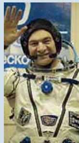
L'astronauta Paolo Nespoli

Ultimo weekend di Arte e Scienza in Piazza, realizzata dalla Fondazione Marino Golinelli in collaborazione con il Comune. La giornata di oggi sarà dedicata allo spazio, a cominciare dal collegamento in diretta telefonica con l'astronauta Paolo Nespoli dalla stazione spaziale internazionale. L'appuntamento è per le 15.15 al laboratorio "In viaggio con l'astronauta" nel Science Center a Palazzo Re Enzo con Sandro Bardelli (I-NAF - Osservatorio Astronomico di Bologna). Ultimo appuntamento alle 17 con i Dialoghi di Arte e Scienza in Sala Borsa. Il maestro del design Alessandro Mendini e il giornalista Luca De Biase si confronteranno su "Design del reale, design del virtuale".